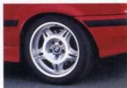
Schön: M3-Räder mit Breitreifen der Dimension 245/40 ZR 17