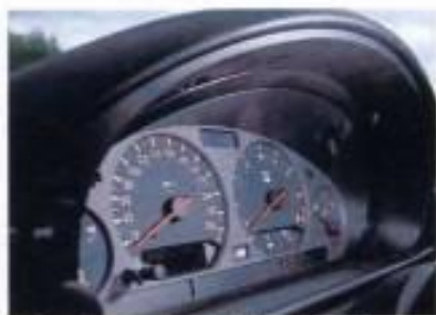
Aufschlußreich: 300 km/h-Tacho im ansonsten unveränderten Cockpit