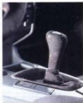
Griffig: Wildleder an Schalthebel und Lenkrad